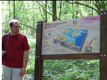
Au bord de la plage !!