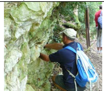
Dans la couche du Pliensbachien, on peut trouver des rostrs de bélemnites (photo du centre). Bien sûr, il faut chercher dans des recoins secrets, à l'abri des regards !