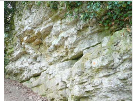
En remontant petit à petit le sentier, nous franchissons des couches géologiques qui représentent des milliers d'années ; à cet endroit, qui était une région côtière, on trouve des grès, au grain très fin (au centre), et des calcaires riches en coquillages, en couches épaisses (à droite)