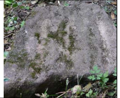
Et d'ailleurs, regardez ces lignes sur cette roche: c'est la trace du ressac. Incroyable, non ?!