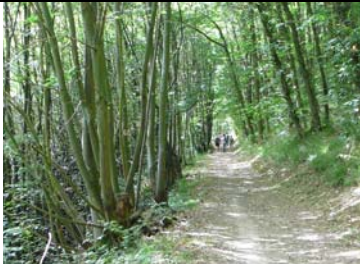
Mais, où nous conduit ce sentier ?