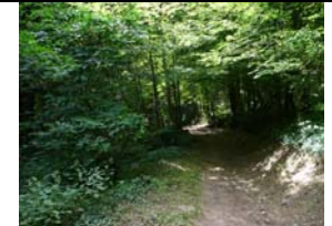
Nous avons la chance de cheminer le long de chemins ombragés; heureusement car il fait très chaud