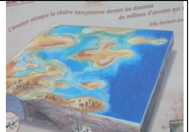
Mais si ! autrefois, la mer était là